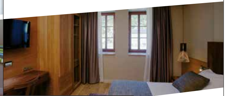
Habitación familiar superior