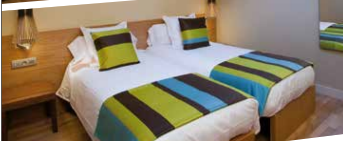
Nuevo apartamento dúplex superior